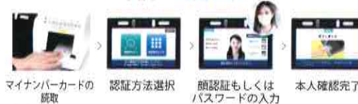
患者さまご利用の流れ